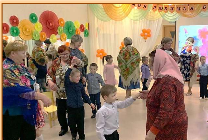
Дети приглашают бабушек на русскую плясовую.

Воспитатель: А сейчас прошу всех встать, Будем вместе танцевать. Дружный танец всех зовет, В наш веселый хоровод!